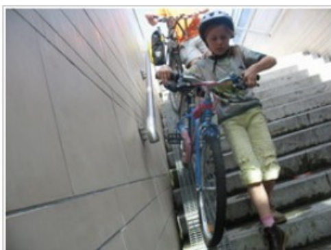
Enfant avec vélo dans l'escalier