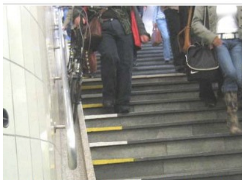
Escalier avec goulotte Granito à Rotterdam